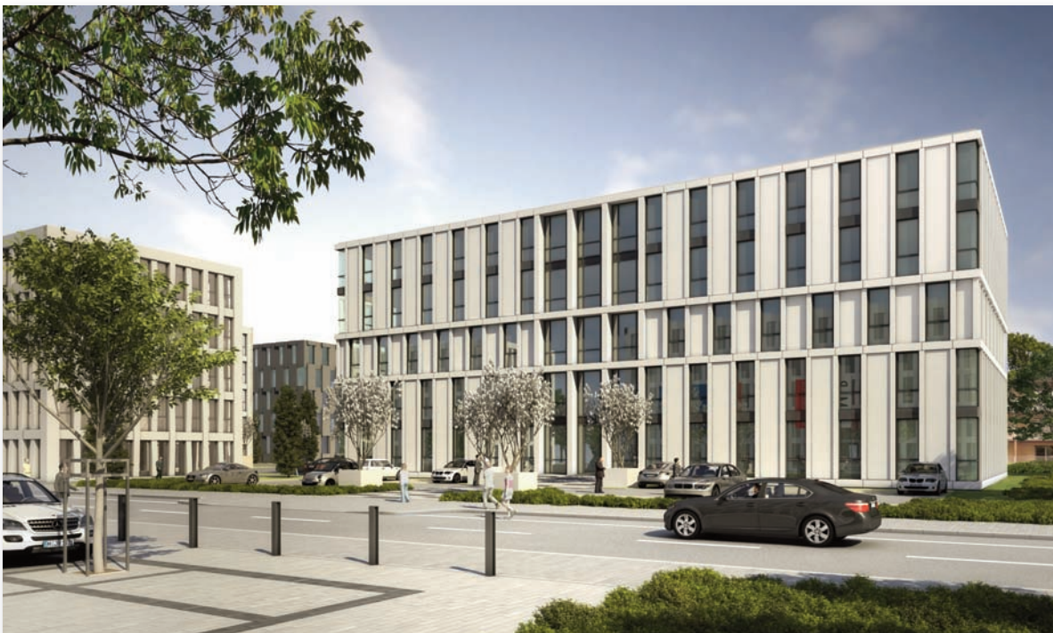
Eastsite III: Ein Spiel mit Licht, Flächen, Perspektiven